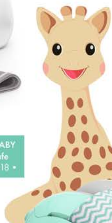
Alpine Muffy BABY Sophie la girafe • 8717154026818 •