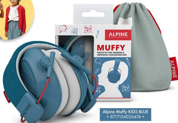
Alpine Muffy KIDS BLUE • 8717154026474 •