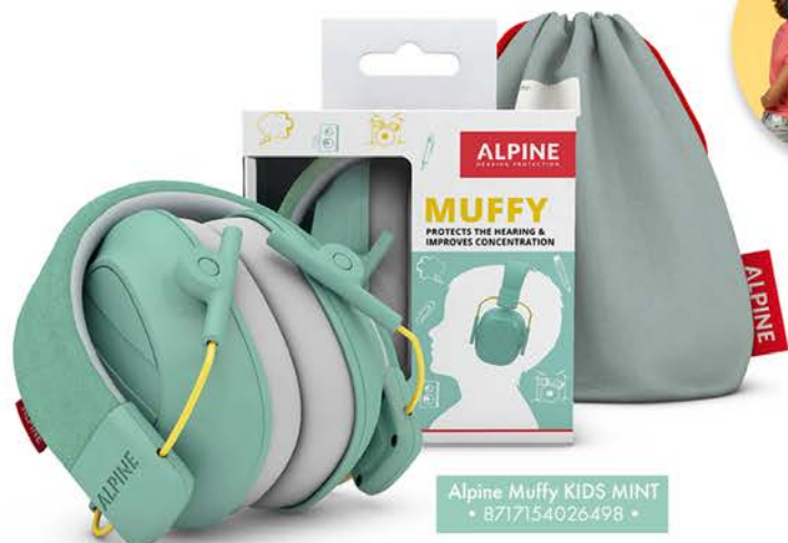
Alpine Muffy KIDS MINT • 8717154026498 •