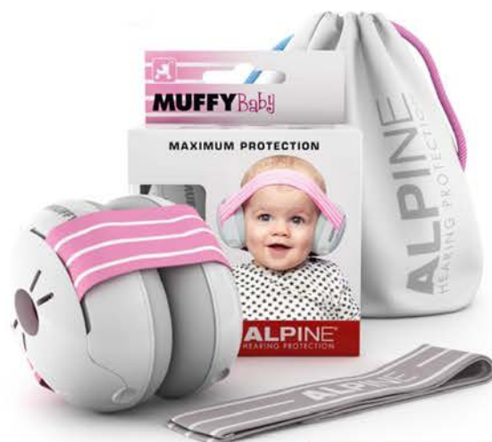
Alpine Muffy BABY ROSE • 8717154024951 •