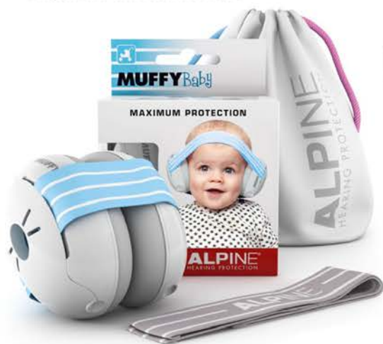
Alpine Muffy BABY BLUE • 8717154024944 •